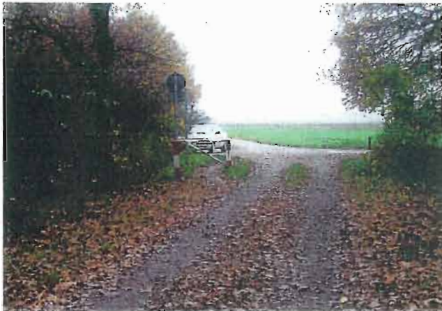
Beste Lösung: Schranke offen halten.

Abhilfe kann hier durch Verbreiterung der Durchfahrt auf mindestens 1,50 m (Regelbreite für Radwege) geschaffen werden.