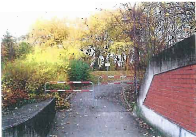
Unterführung B 44 / DB