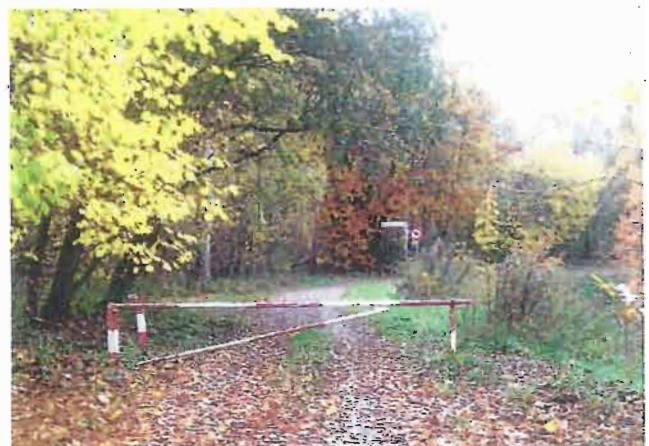
Schranke am Winkelbach