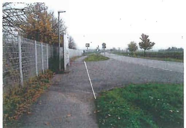
Weg oft zugeparkt / Markierung anbringen