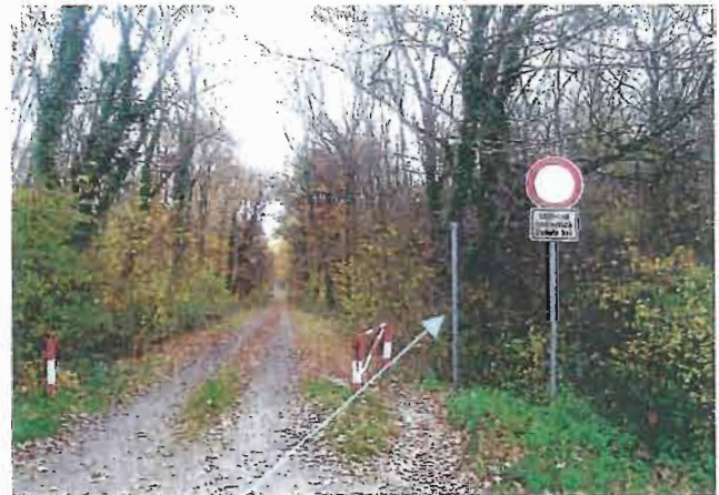
Schilderpfosten unnötig !