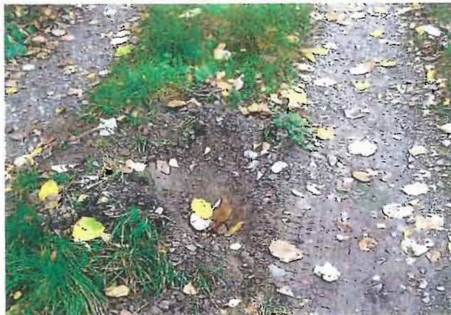
Löcher im Radweg