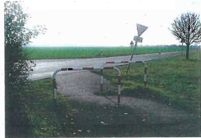
Schranke L 3261