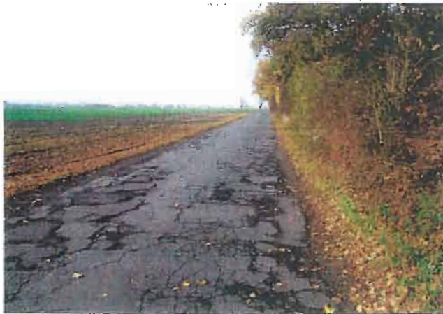
Fahrbahn uneben / Schlaglöcher