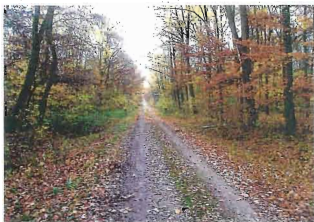
Oberfläche des Weges uneben und schmierig